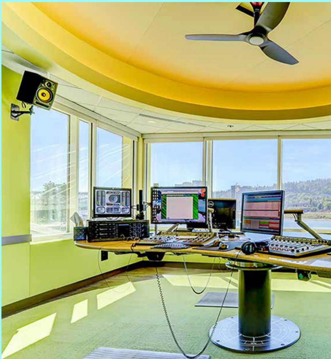
El estudio al aire de All Classical Portland en Portland, Oregon