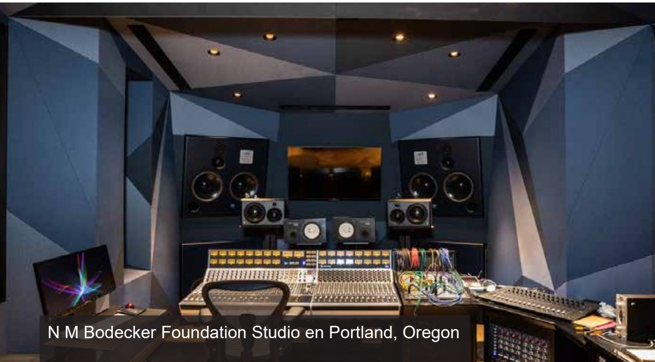
N M Bodecker Foundation Studio en Portland, Oregon