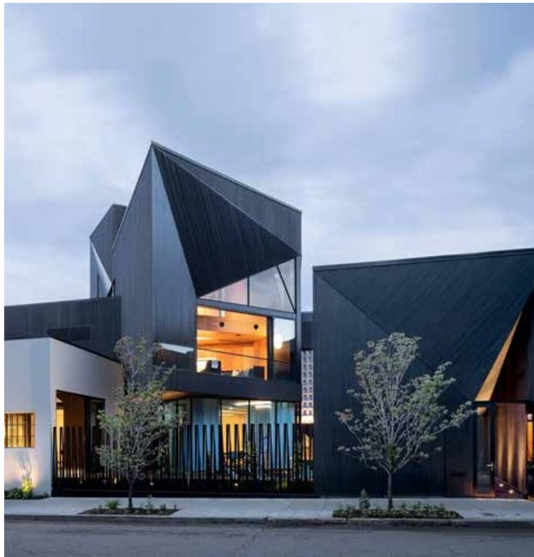
N M Bodecker Foundation Studio en Portland, Oregon

Llamado a nominaciones. All Classical Portland desafía a oyentes, artistas del noroeste del Pacífico y organizaciones de artes escénicas a nominar obras musicales de compositores clásicos subrepresentados para grabarlas y publicarlas a través de la Iniciativa de grabación inclusiva.